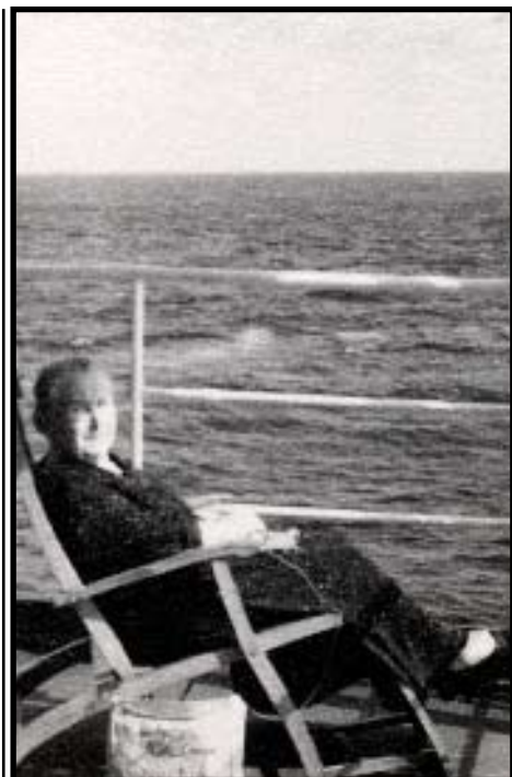
Das ist meine Großmutter im Jahre 1959 auf dem norwegischen Schiff Herborg, auf dem ich mit ihr gemeinsam nach Argentinien fuhr.