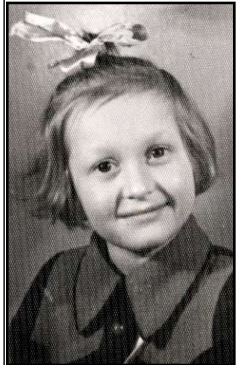
Das bin ich März 1946 in Moskau, im Kindergarten.

Ich habe versucht, später mit meiner Mutter darüber zu sprechen. Was ich aus ihr herausgekriegt hab, bis zum Schluss ist, dass sie gesagt hat: ‚Du darfst nie vergessen, dass dieses Land uns das Überleben ermöglicht hat.‘ Ich glaube nicht, dass meine Eltern bewusst etwas zugedeckt haben.