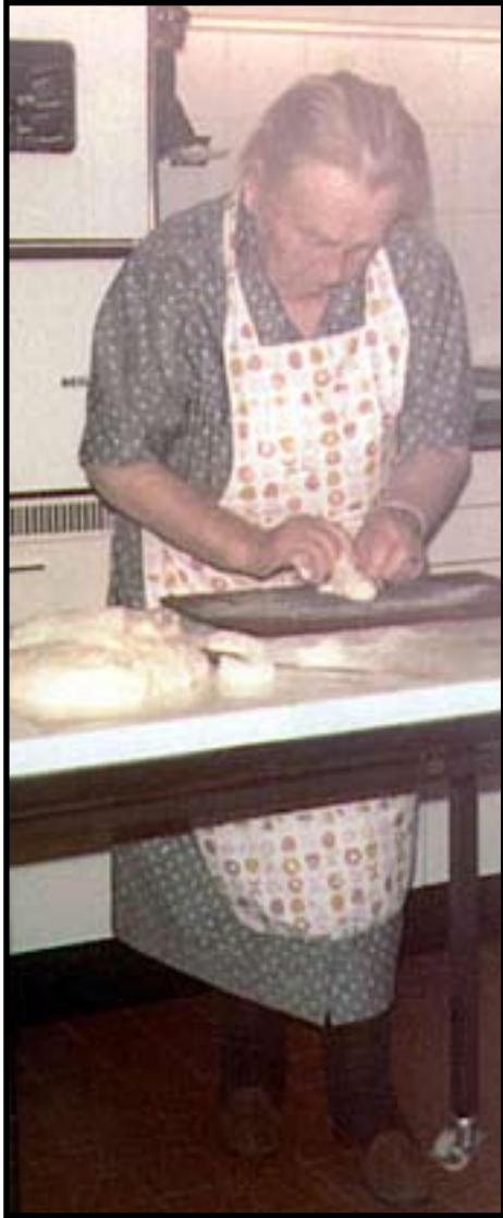
Das ist meine Großmutter in meiner Küche, wie sie Weckerln formt, also Miniatur Barches [Anm.: zopfartig geflochtenes Schababrot]. Da hat sie mir gezeigt, wie sie das flechtet. Barches werden bei uns seit vielen Jahren wöchentlich gefertigt.